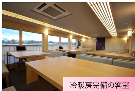
冷暖房完備の客室